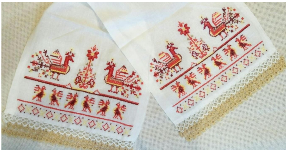
Хоцкая Виктория 15 лет