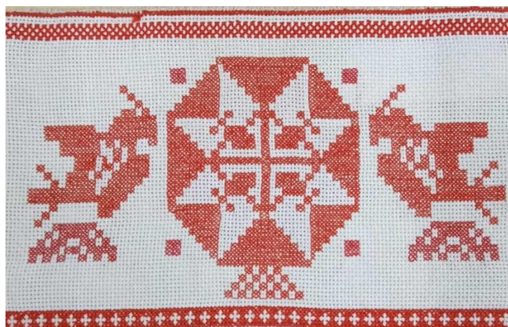
Катило Юля 14 лет «Ярило»