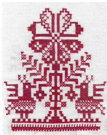
Бузлукова Ксения 14 лет