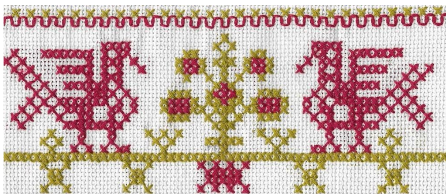
Шипилова Настя 13 лет