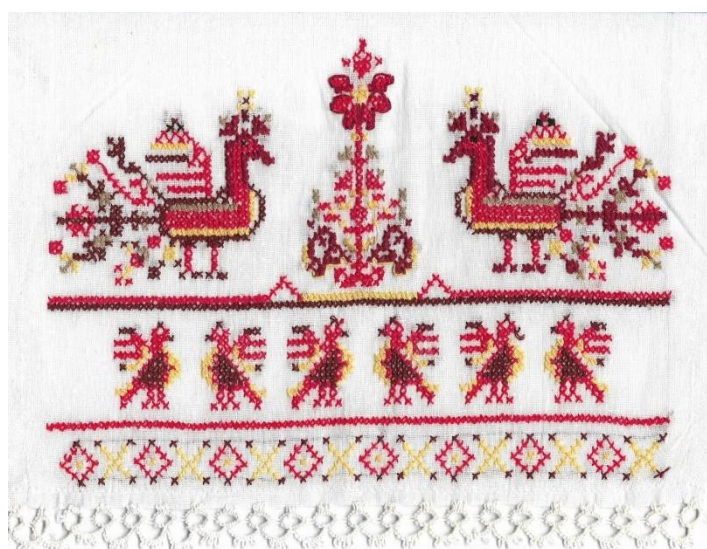
Хоцкая Вика 14 лет