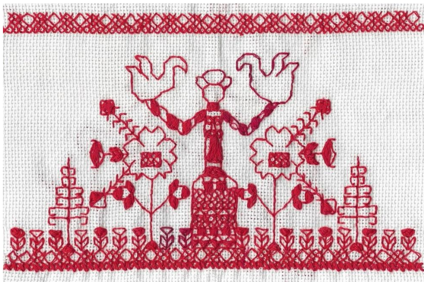
Саримсаков Фируз 13 лет