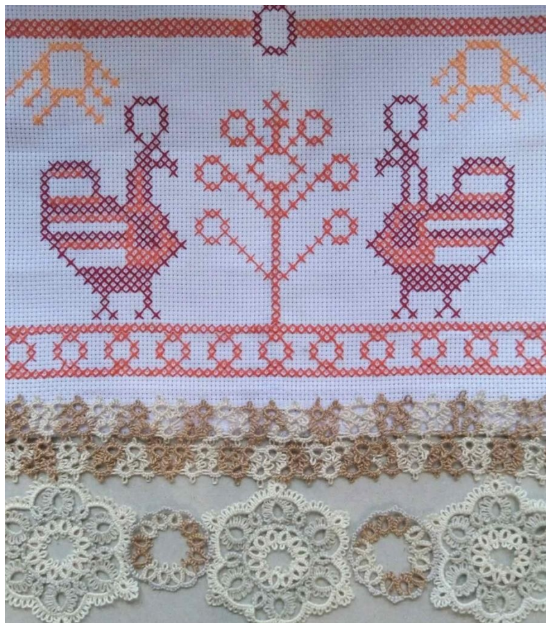
Карчава София 13 лет