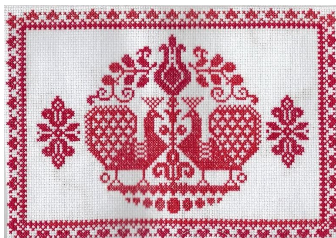
Бугайчук Никита 13 лет