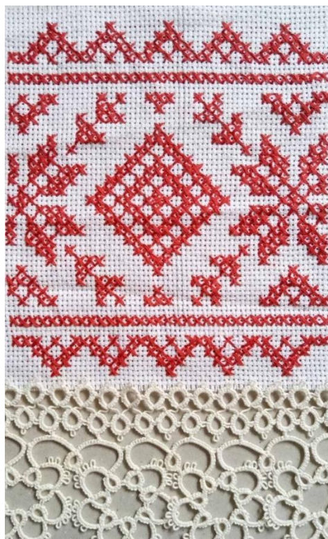
Плотникова Юлия 14 лет