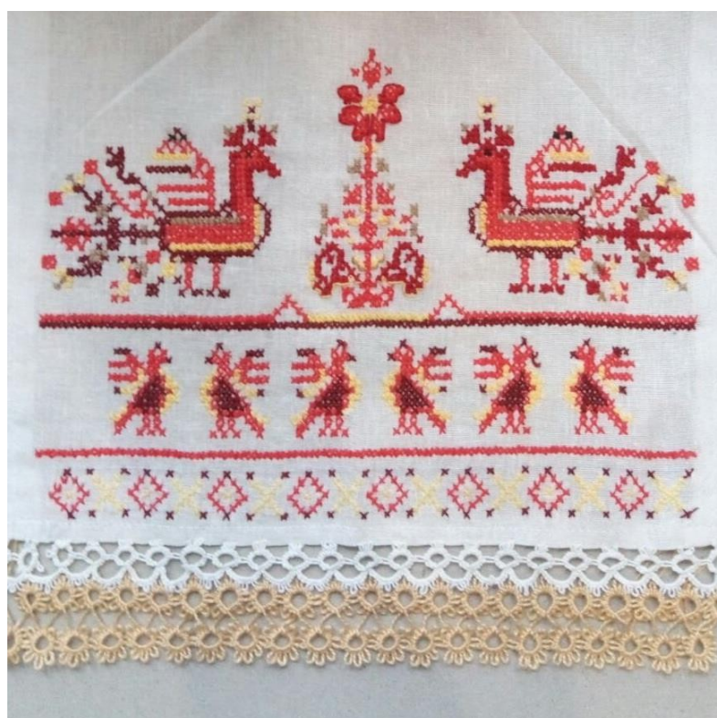
Хоцкая Виктория 15 лет