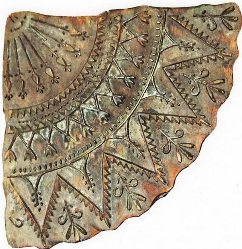
Набойная доска.

Формы для набойки изготавливают резные деревянные (манеры) или наборные (наборные медные пластины с гвоздиками), в которых узор набирается из медных пластин или проволоки.