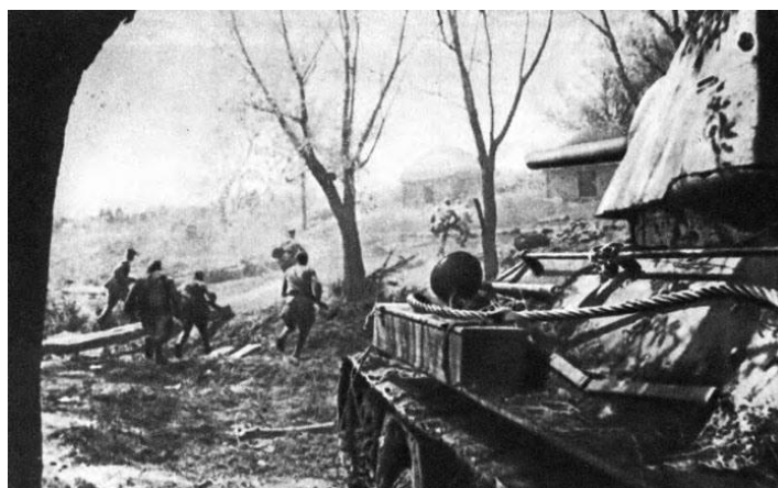
Бои за белорусский населённый пункт. 1943 г.