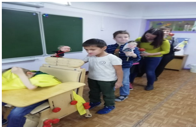
Обыгрывание сказки « Репка»

Для освоения добукварного периода, который длится от 2 до 6 месяцев предшествует программный материал с сведениями о природе, жизни детей в школе, в семье. Наблюдениями о животных и окружающем мире.