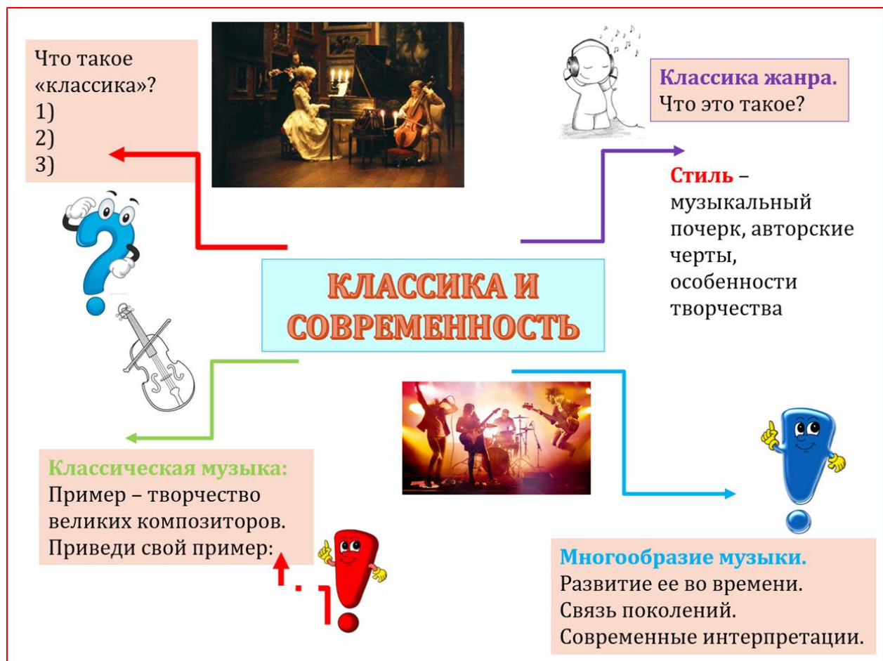
Рис. 2 Пример интеллектуальной карты по теме «Классика и современность»

Следующая ветвь раскрывает понимание развития музыки, ее многообразия, новые интерпретации музыкальных произведений во времени.