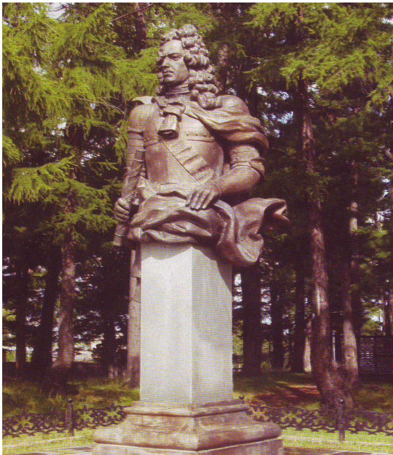
Памятник светлейшему князю А.Д. Меншикову (1993 г.).