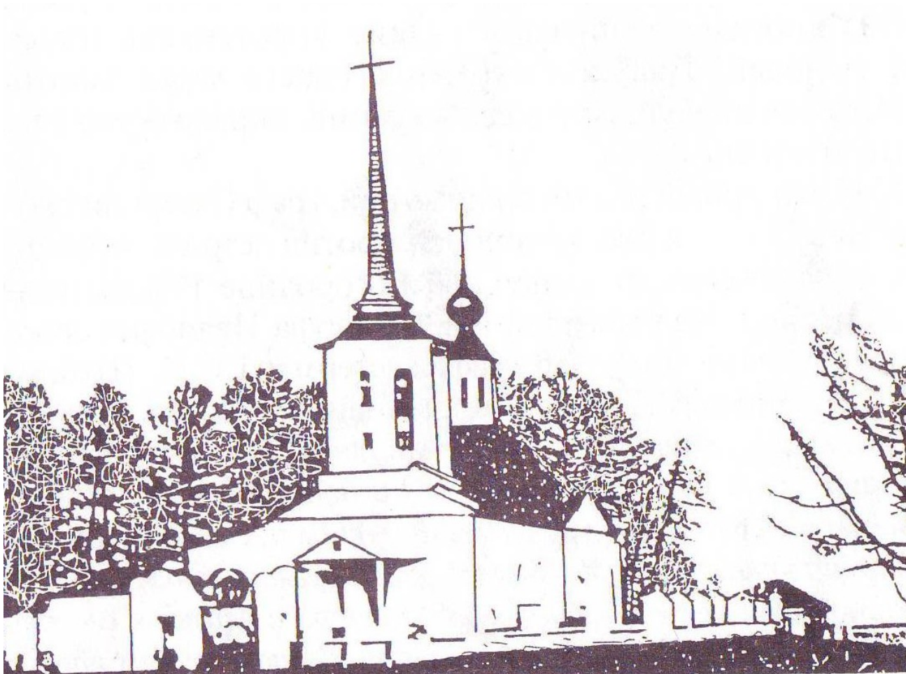
Церковь Рождества Богородицы